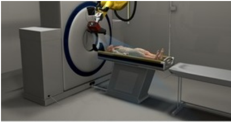
Ein hochbeweglicher Industrieroboter namens «Virtobot» zeichnet die Konturen einer zu untersuchenden Leiche auf. Durch den gleichzeitigen Einsatz von Computertomographen erhalten die Gerichtsmediziner ein dreidimensionales Bild und können die Leichen digital konservieren. Un robot industriel extrêmement souple, baptisé «Virtobot», enregistre les formes du cadavre à examiner. Le recours simultané à la tomodesitométrie fournit aux médecins légistes une image en trois dimensions, permettant ainsi la conservation numérique des corps.

Ein hochbeweglicher Industrieroboter namens «Virtobot» zeichnet die Konturen einer zu untersuchenden Leiche auf. Durch den gleichzeitigen Einsatz von Computertomographen erhalten die Gerichtsmediziner ein dreidimensionales Bild und können die Leichen digital konservieren. Un robot industriel extrêmement souple, baptisé «Virtobot», enregistre les formes du cadavre à examiner. Le recours simultané à la tomodesitométrie fournit aux médecins légistes une image en trois dimensions, permettant ainsi la conservation numérique des corps. A high-mobility industrial robot by the name of Virtobot records the contours of a cadaver under examination. Using computed tomography at the same time, forensic doctors are provided with a three-dimensional image and can conserve corpses digitally.