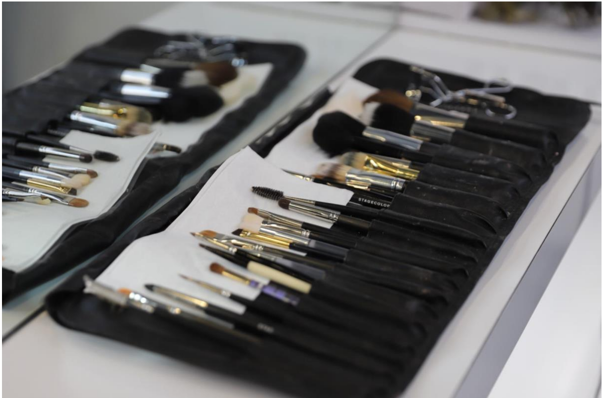
Bild 1: Durch die Partnerschaft mit La Biothétique und fortlaufenden Weiterbildungen stellt AERNI Bern sicher, dass die Mitarbeiter:innen stets auf dem neusten Stand der Techniken und Trends im Bereich Make-up sind.

Bern, im April 2024. AERNI Bern investiert in die Weiterbildung seiner Mitarbeiter:innen und stärkt damit nicht nur deren Fähigkeiten, sondern auch das Serviceangebot für die Kundinnen: Vom passenden Haarschnitt über schonende Colorationsmethoden bis hin zum individuellen Styling und einem Make-up, das perfekt auf den jeweiligen Typ abgestimmt ist.