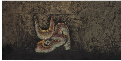
05 Hamed Abdalla Al Harb , 1963 Mischtechnik auf Japanpapier auf Isorel 130 x 250 cm Artist estate

Alle Urheberrechte bleiben vorbehalten. Die Bildlegende muss vollständig übernommen und das Werk wie abgebildet reproduziert werden. Die Bilder dürfen nur im Zusammenhang mit der Berichterstattung zur Ausstellung FOKUS: Hamed Abdalla (1917–1985) verwendet werden