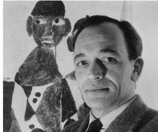
06 Hamed Abdalla in Kopenhagen, 1959