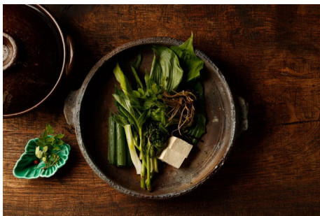
Ein Leckerbissen: Satoyama Jujo Resort in Niigata