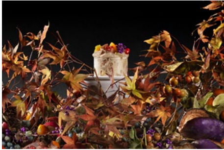
Entsteht am Tisch dank Mikrohefen: das «Brot des Waldes» von Starkoch Yoshihiro Narisawa aus Tokio (Narisawa)