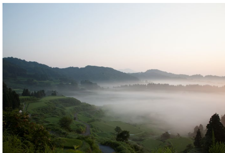
Quelle der Inspiration: Umliegende Felder und Wiesen des Satoyama Jujo Resorts in Niigata