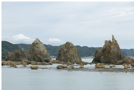
Mysteriöses Naturkunstwerk in der Küstenstadt Kushimoto, dort wo der nachhaltige Fisch gezüchtet wird (Kushimoto)