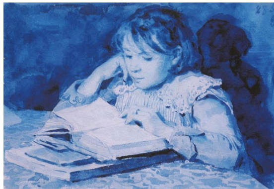
06 Albert Anker Cécile Anker , 28 septembre 1886 Peinture faïence bleue dur papier 16,9 x 23,3 cm Centre Albert Anker, Ins