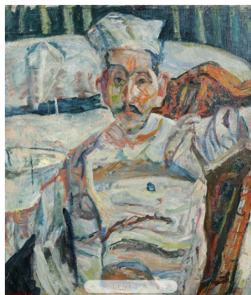
07 Chaïm Soutine Le Cuisinier de Cagnes , vers 1924 Huile sur toile 61 x 51 cm Kunstmuseum Bern, legs Georges F. Keller 1981