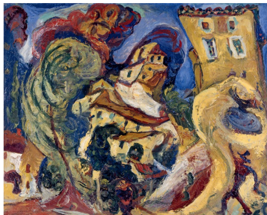
08 Chaïm Soutine Paysage de Cagnes , vers 1923 Huile sur toile 60 x 73 cm Kunstmuseum Bern, legs Georges F. Keller 1981