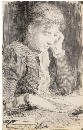
05 Albert Anker Lesendes Mädchen [ fille lisant], 1898 Plume et encre de Chine sur papier 18 x 11,3 cm Kunstmuseum Bern Dépôt de la Confédération suisse, Office fédéral de la culture, Fondation Gottfried Keller

Tous les droits d'auteur sont réservés. La légende doit être reprise intégralement et l'œuvre doit être reproduite telle qu'elle est présentée. Les photos ne peuvent être utilisées que dans le cadre d'un reportage sur les expositions du Kunstmuseum Bern.