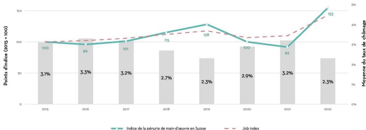
Indice de la pénurie de main-d'œuvre en Suisse, job index et taux de chômage

Zurich, le 28 novembre 2022 – Après un relâchement de la tension imputable à la pandémie de COVID-19 au cours des deux dernières années (2020 et 2021), la pénurie de main-d'œuvre qualifiée en Suisse repart à la hausse de manière spectaculaire. L'indice de la pénurie de main-d'œuvre qualifiée atteint actuellement un niveau record, faisant du recrutement de personnel un défi majeur pour les entreprises. Les postes de professionnels de la santé, d'informaticiens et d'ingénieurs sont particulièrement difficiles à pourvoir en ce moment. Dans le sud-ouest de la Suisse, la demande en professionnels de l'industrie a particulièrement augmenté. Voilà ce que révèle l'indice de la pénurie de main-d'œuvre du Groupe Adecco Suisse et du Moniteur du marché de l'emploi suisse de l'Université de Zurich.