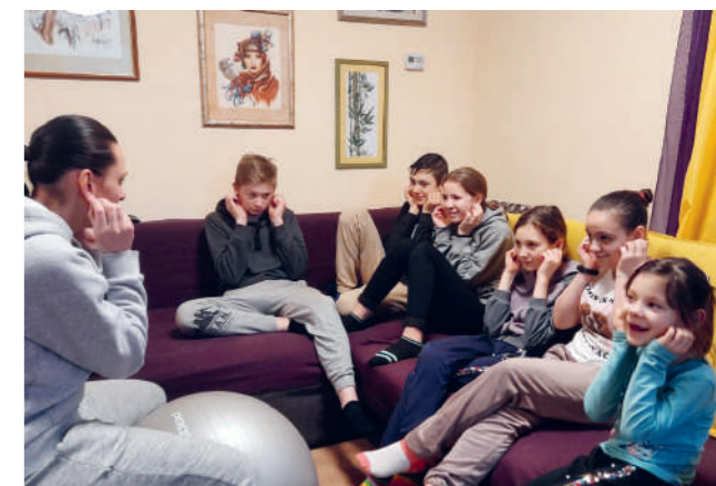
Une psychologue avec des enfants.