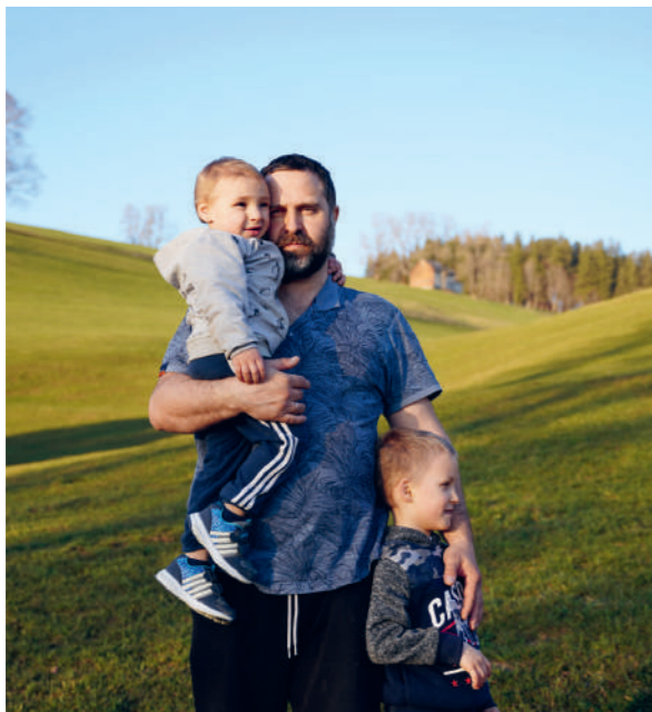
Un père et ses deux enfants (placés) à Rehetobel (AR).