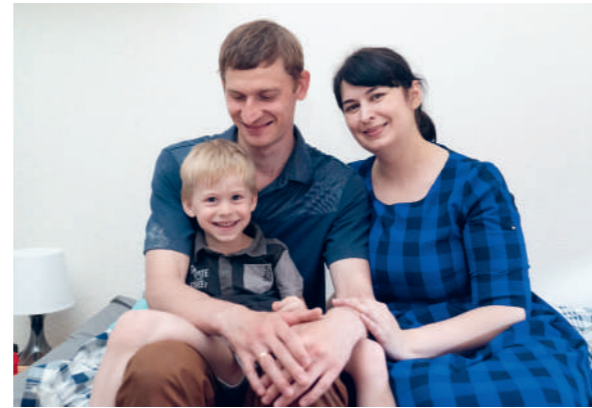
Une famille de réfugiés à Gilly (VD).

La guerre en Ukraine continue d'avoir des conséquences dévastatrices pour des millions d'enfants et de familles. Plus de trois mois après le début des combats, les infrastructures civiles du pays sont en grande partie détruites. Les principaux services publics se sont effondrés et ne peuvent plus être assurés. Au moins 24 millions de personnes dépendent de l'aide humanitaire.