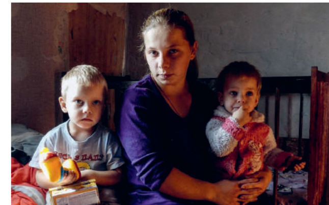
Une mère et ses enfants à Louhansk.