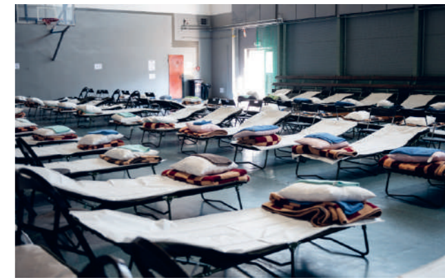
Un hébergement pour réfugiés en Pologne.

Advocacy. Dès le départ, l'une des priorités de SOS Villages d'Enfants Ukraine a été d'attirer l'attention des médias sur les besoins des enfants n'ayant pas une prise en charge parentale suffisante et sur leurs besoins en structures familiales pour remplacer l'environnement institutionnel.