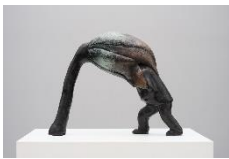
Grace Schwindt, Man and Flower , 2019, Courtesy Zeno X Gallery, Antwerp, Foto: Peter Cox

Die Plastikerin und Performancekünstlerin Grace Schwindt, *1979 Offenbach, verwendet für ihre Installationen raumgreifende Bühnenbilder mit architektonischen Elementen, ornamentalen Kostümen und Requisiten, die sich auf einen spezifischen Ort oder Schauplatz beziehen. Im Ausstellungsrundgang platziert sie skulpturale Körper sowie Arrangements und verwendet hierfür eine konzise Choreografie.