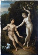
Pieter van der Werff, Adam und Eva , 1716, Leihgabe aus Privatbesitz

Liebe und Leidenschaft in der Kunst – auf der Suche nach Vollendung: Perfect Love! Ob galant oder begehrllich, romantisch oder erotisch, die Liebe hat in der Kunst vielfältig Ausdruck gefunden und war seit jeher Antrieb und Herausforderung kreativen Schaffens. Solchen Darstellungen der Liebe geht die Ausstellung Perfect Love in einer thematischen Auswahl aus der hauseigenen Sammlung nach.