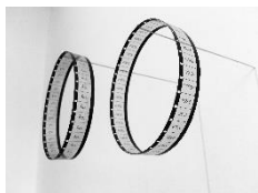
Manon de Boer, For C.A. (Her Voice) , 2020, Courtesy die Künstlerin und Jan Mot

Manon de Boer, * 1966 Kodaikanal, arbeitet hauptsächlich im Medium Film. Die Wahrnehmung der Zeit und die Inspiration für Schaffensprozesse stehen genauso im Zentrum ihrer Arbeit wie die Produktions- und Rezeptionsbedingungen des Films. Menschen erscheinen in den Werken von de Boer durch ihre physische oder sonore Präsenz. Ihr Blick ist nach innen, in Beziehung zu sich selbst gerichtet. Oder steht in Verbindung zu anderen, einem Raum, einer Stadt oder einer Landschaft.