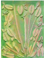
Andreas Slominski, xSBy28z, 2008

Andreas Slominski, * 1959 Meppen, gehört zu den bedeutendsten Plastikern seiner Generation und wurde als Künstler, der «Fallen stellt», international bekannt. Mit einer guten Portion Witz und Ironie betrachtet er unsere alltäglichen Erfahrungen und privaten Obsessionen. Für St.Gallen entwickelt er eine spezifische Installation – mit jenem Schuss Erotik, der die Konditionierung und Ideologie unseres Alltags so unerbittlich offenlegt.