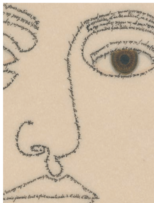
Miriam Müller, Selbstporträt (Detail), Schrift, Tinte, Gouache auf Pergamin, 33×22 cm