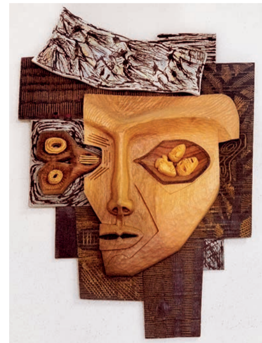
Manuel Müller, «Tête aux étourneaux», 2017, Holz, Malerei, 90×64×10 cm, © Adagp, Paris, 2021