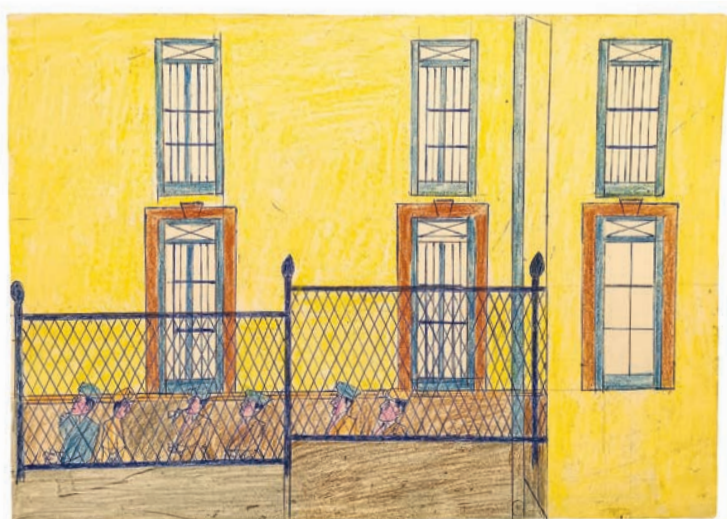
Giovanni Abrignani, Im Hof der Ospedale Psichiatrico Provinciale Trapani, um 1967–1975, Farbstift, Kugelschreiber auf Papier, 24,5×34,5 cm