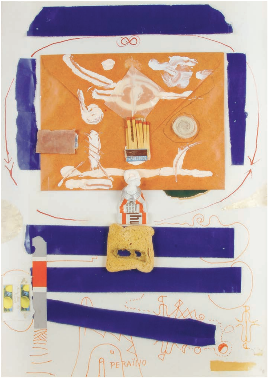
Robert Müller, Ohne Titel, 1975, Filzstift auf Papier, Collage, 56,5×41,5 cm, Kunstmuseum Solothurn, Foto: Claudia Juranits, © Adagp, Paris, 2021