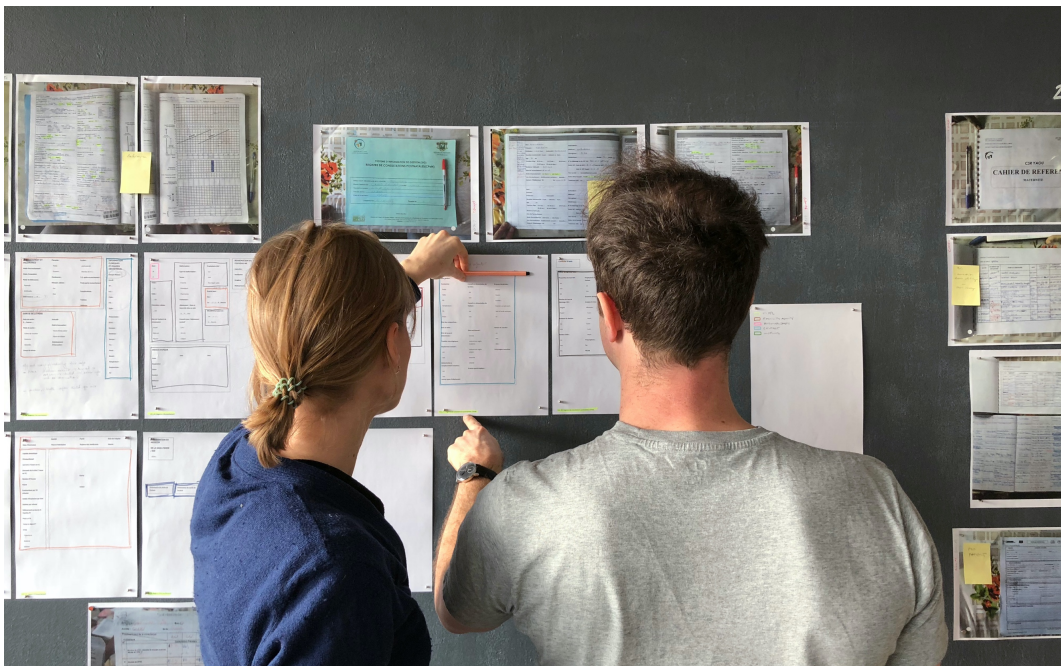
Statt klassischer Formulare: leicht verständliches Informationsdesign zu Gesundheitsthemen in drei afrikanischen Ländern – entwickelt von Superdot für das Schweizer Tropeninstitut.