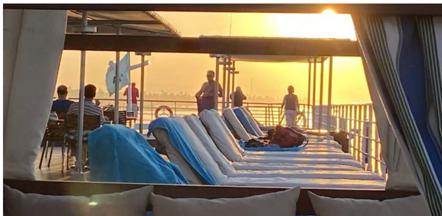
Sonnenuntergang an Deck der Alyssa.