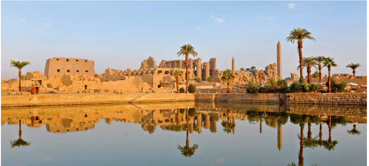
Tempelanlage von Karnak