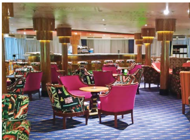
Ausdrucksstarkes nubisches Design in Lounge und Bar.