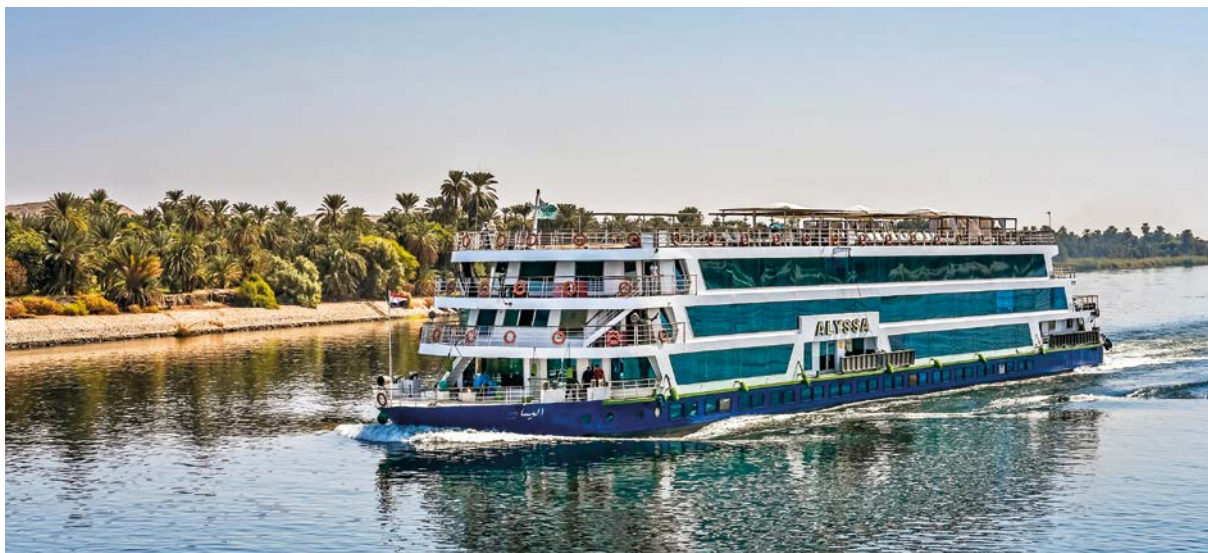
Die Alyssa auf dem Nil.