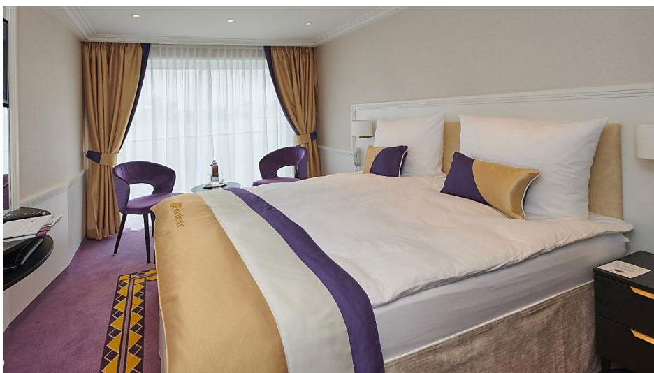
Doppelkabine 16 m 2