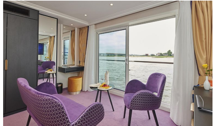
Junior Suite 20 m 2