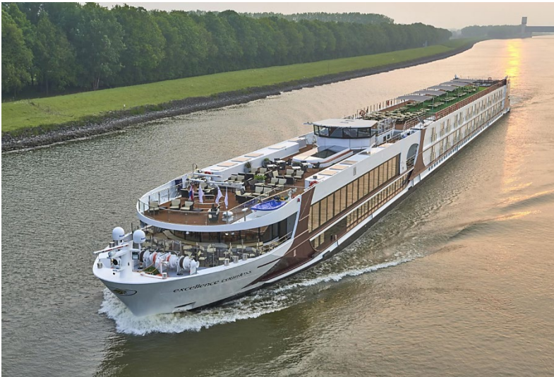
Jungfernfahrt der Excellence Countess von Nijmegen zum Heimathafen Basel 17.-23.05.19