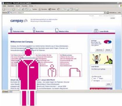
www.carepay.ch – Die Informationsplattform zu elektronischen Abrechnung im Gesundheitswesen

Rechtzeitig zur Einführung der elektronischen Abrechnung am 1. Januar 2006 ist Carepay.ch online. Ärzte und Patienten erhalten hier spezifische, transparente und umfassende Informationen über die Einführung und deren Vorteile. Weitere Themen sind die Einhaltung von Daten- und Patientenschutz, rechtliche Bestimmungen oder die technischen Voraussetzungen. Auch können Besucher ihre Meinung sowie ihre Stimme zur Wahl des Abrechnungsweges abgeben. Und damit vor lauter ernsthaften Themen auch die spassige Seite nicht zu kurz kommt, sorgt das Online-Game «Medi-Jump» für unterhaltsame Abwechslung. Werfen Sie einen Klick hinein: www.carepay.ch .