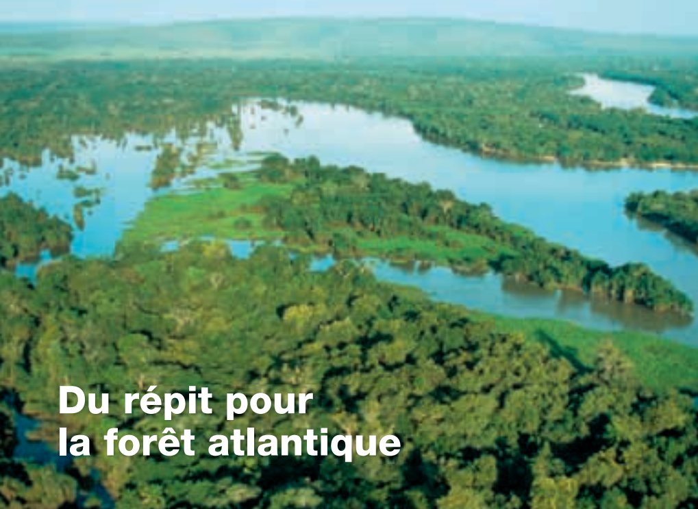
Du répit pour la forêt atlantique