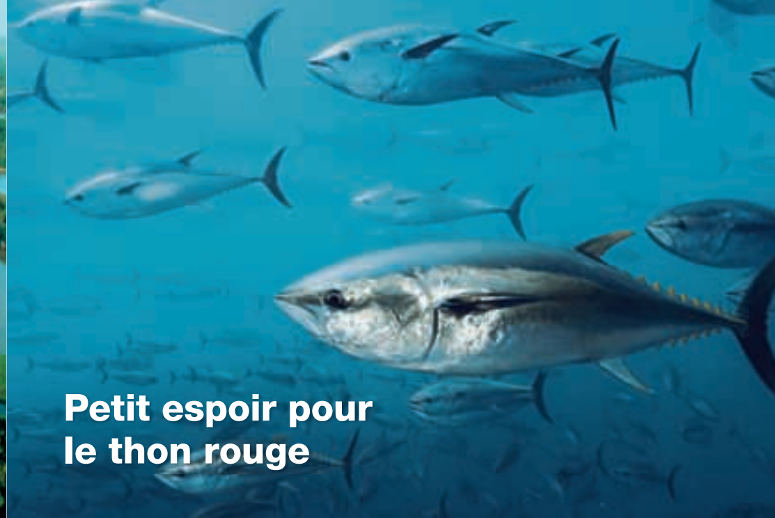
Petit espoir pour le thon rouge