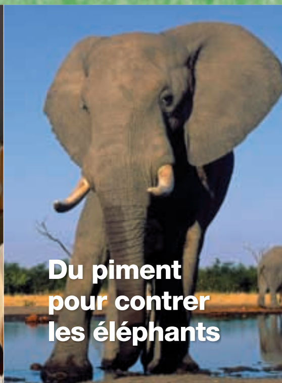
Du piment pour contrer les éléphants