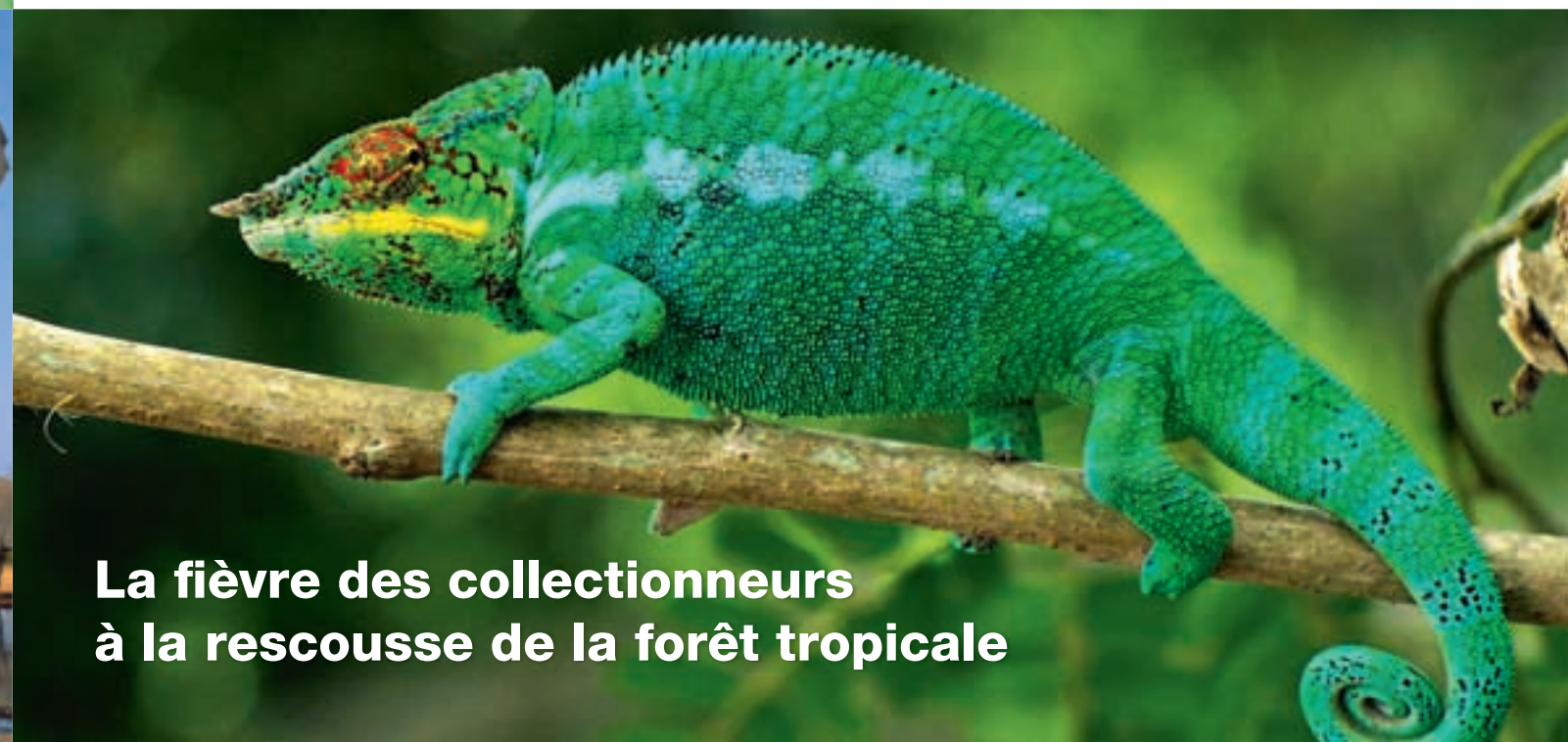
La fièvre des collectionneurs à la rescousse de la forêt tropicale