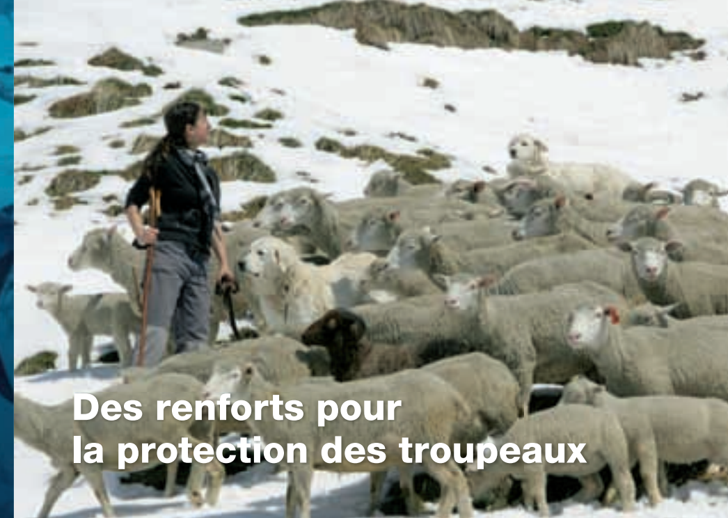
Des renforts pour la protection des troupeaux