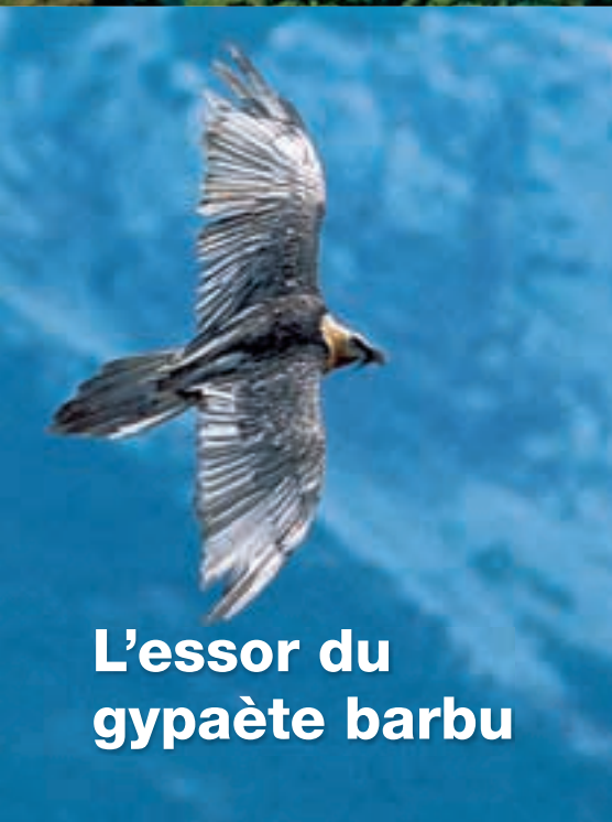
L'essor du gypaète barbu