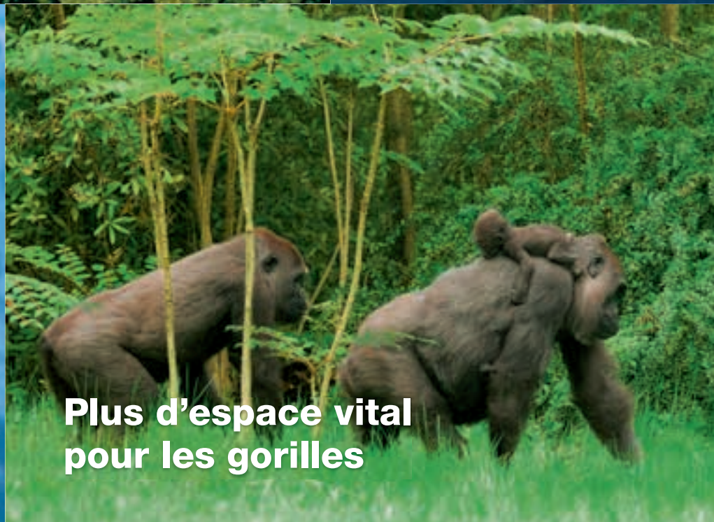
Plus d'espace vital pour les gorilles