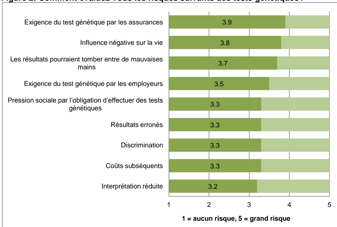
Figure 2: Comment évaluez-vous les risques suivants des tests génétiques?