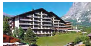
Sunstar Hotel Grindelwald ****