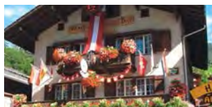
Hotel Alte Post