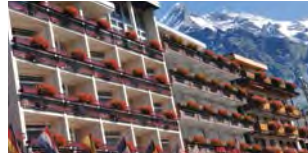
Hôtel Kreuz & Post

Annegret Gruber Tél. 033 853 42 42 altepost@grindelwald.ch www.altepost-grindelwald.ch