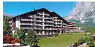
Sunstar Hotel Grindelwald ****