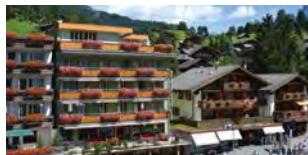
Hôtel Central Wolter

Famille Glarner Tél. 033 854 38 18 info@hotel-caprice.ch www.hotel-caprice.ch