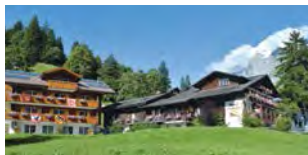
Wellnes Hotel Caprice

Famille Stettler Tél. 033 854 18 18 info@parkhotelschoenegg.ch www.parkhotelschoenegg.ch