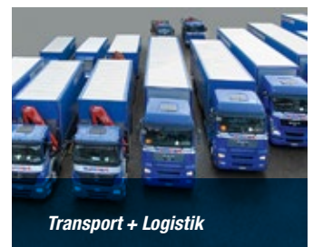
Transport + Logistik

Branchenleader und Spezialist für Spengler, Dachdecker, Fassadenbauer und Isolierspengler