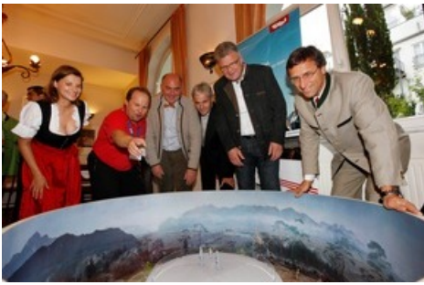
BILD zu TP/OTS - Anlaesslich der RDA Messe in Koeln, der Messe des Internationalen Bustouristik Verbandes, organisierte die Tirol Werbung einen informativen Tirol Abend. Anwesend waren 50 internationale Medienvertreter, Vertreter aus der Busreise- und Gruppentouristikbranche sowie Partner aus Tirol. / Weiterer Text ueber ots und auf http://www.presseportal.ch . Die Verwendung dieses Bildes ist fuer redaktionelle Zwecke honorarfrei.

Diese Meldung kann unter https://www.presseportal.ch/fr/pm/100000449/100701458 abgerufen werden.